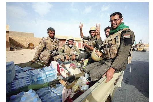
▲2017年11月3日，伊拉克政府军向极端组织“伊斯兰国”控制区发起“最后进攻”

2017年11月21日，伊拉克总理阿巴迪和伊朗总统鲁哈尼分别宣布，伊拉克和叙利亚境内的极端组织已经被消灭，“伊斯兰国”从军事上被终结。俄罗斯随后也宣布俄军在叙利亚的反恐任务完成并开始撤军。另一方面，极端组织外溢效应不断冲击世界多国，暴力恐袭事件频仍，全球反恐压力不减反增。