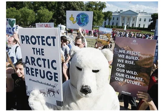
▲2017年6月1日，美国多地民众游行抗议特朗普政府退出《巴黎协定》

2017年1月23日，美国退出跨太平洋伙伴关系协定。之后，美国接连宣布退出气候变化《巴黎协定》，退出联合国教科文组织以及退出《移民问题全球契约》。特朗普政府坚持奉行“美国优先”政策，折射出的单边主义倾向正在扩大其与国际社会在全球治理领域的分歧。这种“退出外交”不仅意味着美国在逐步有选择地放弃国际责任，也给世界局势带来更多不确定性。