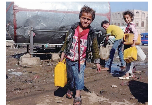
▲2017年11月27日，也门萨那的儿童在当地人道主义机构处排队接水

2017年，中东局势因多国交恶，持续动荡。6月，沙特连同多个伊斯兰国家先后宣布与卡塔尔断交，海合会分裂，危机至今未解。12月4日，也门前总统萨利赫在也门内战中身亡。12月6日美国宣布承认耶路撒冷为以色列首都，触动中东“敏感神经”，引发抗议风波持续发酵。巴以和平进程更加脆弱。