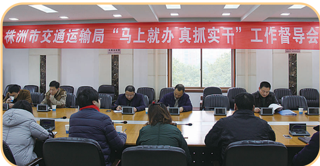
株洲市交通运输局“马上就办真抓实干”工作督导会

马上就办,放在任何时候都具有积极而深远的意义。今年以来,市交通运输局通过全面推进“马上就办”,在全局实现了“效能革命”。