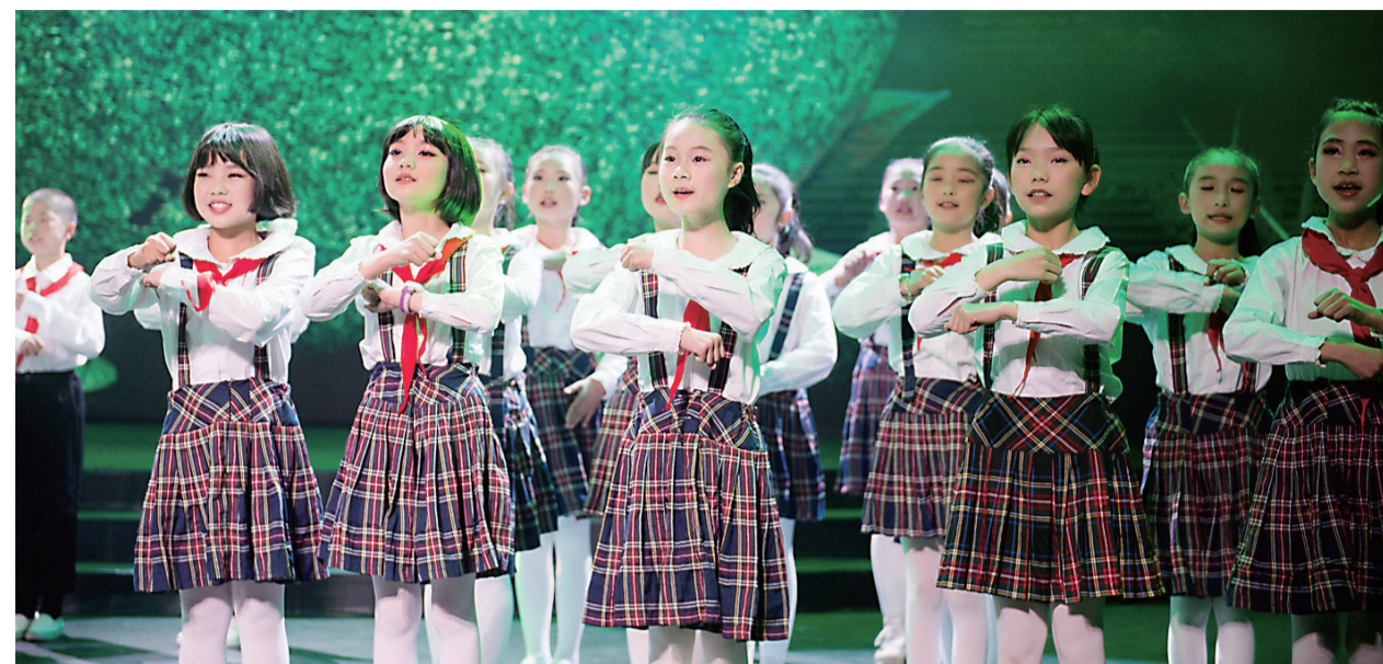
▲颁奖典礼现场