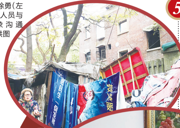
▲棚改区一隅,随意堆放杂物的通道增加了不少安全隐患