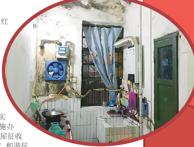
▲一位住户家中的厨房墙面已经严重渗漏起霉,棚改是一家人非常期盼的事情