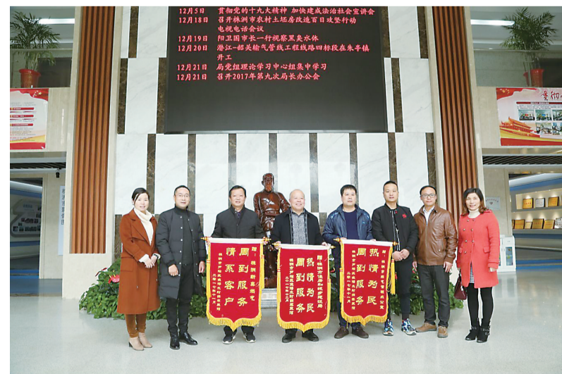
▲店主为市住建局送锦旗