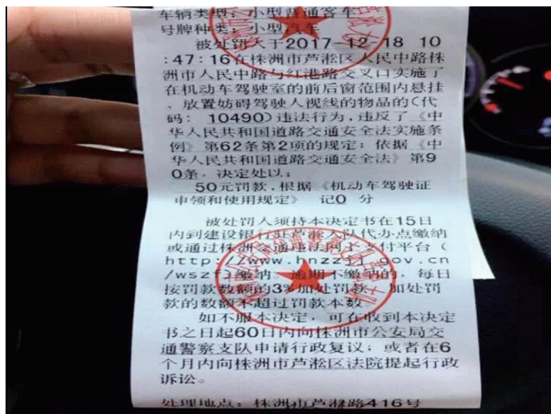
▲这名车主因自家车内悬挂饰品被罚款50元

本报讯(记者 肖蓉 通讯员 张雅君)最近,有一张图片在朋友圈里热传,我市一名驾驶员因为在车上悬挂物品,被交警开出了罚款50元的罚单。