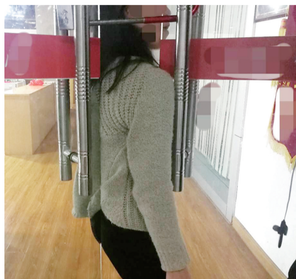
▲现场实验,门缝距离有十五六厘米宽,身材瘦小者可以挤入

本报讯(记者 李卉 通讯员 阎俊 陈双蓉)“从11月开始,我发现店里陆续丢东西,每次数量都不大,像老鼠搬家一样。”职教城某学院咖啡店的老板说,两个月来损失合计一万余元,但门窗均没有损坏,真不知道东西是怎么丢的?