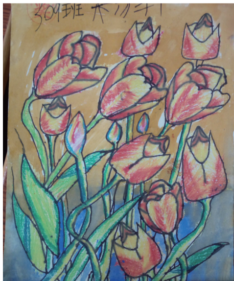
309班 杨邦 证号:0435217