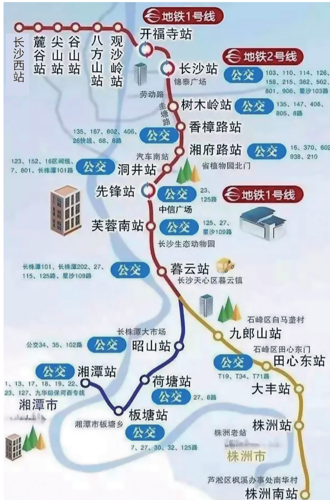
▲长株潭城铁线路示意图

由于线路延长且长沙西站改为始发终到,长沙西、株洲南的首班车调整为6:30左右,湘潭站的首班车仍维持在7:00左右,尾班均继续保持在22:30左右,以适应线路加长、长株潭三市之间通勤及与地铁公交换乘需要。(记者 肖蓉)