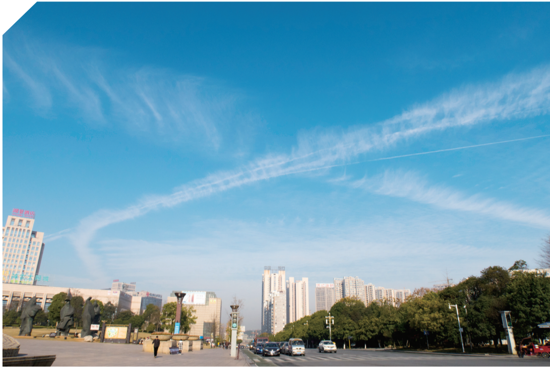
▲昨日,在神农城广场上空,一道“X”型白云,成为独特的风景