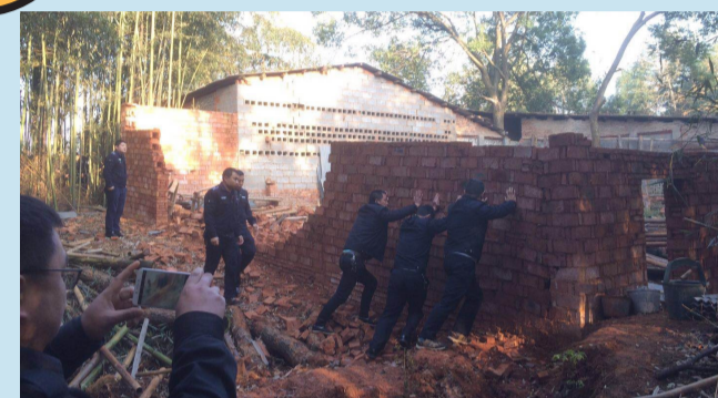
▲拆除现场