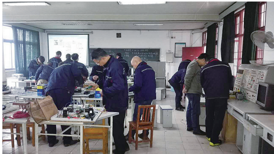
▲维修电工培养工程吸引了不少男性参加