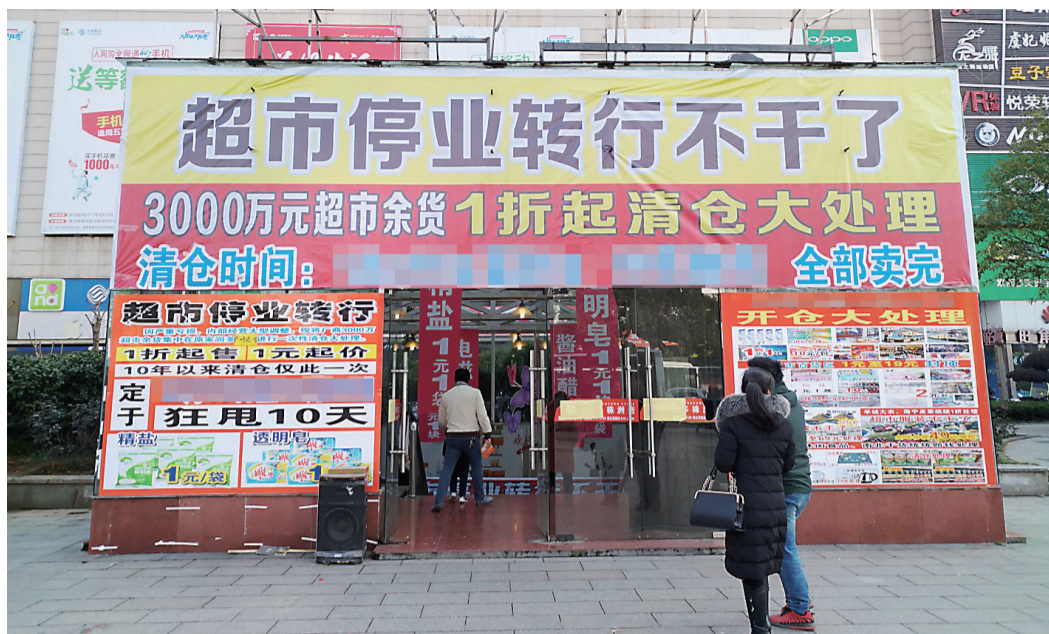
▲位于超市门口的巨幅广告

根据产品外包装上的代码，客服人员查询后回复，记者购买的这两款产品都不是宝洁中国公司所生产，建议记者联系工商部门举报。