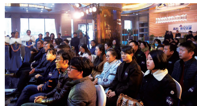
高科·壹号领域 140-230平德式大平层,装下你奢华的舒适人生 现加入君子会会员,享受更多会员福利,详情致电咨询 项目地址:天元区·栗雨湖(高科·总部壹号旁) 尊享热线:0731-2881 3333

上午11点,高科·壹号领域营销中心开放活动圆满落幕,感谢每一位贵宾的支持。作为实力国企,高科·壹号领域将沿袭高科一贯以来的匠心于人、精工质造,为株洲人民演绎最精粹的理想品质生活。