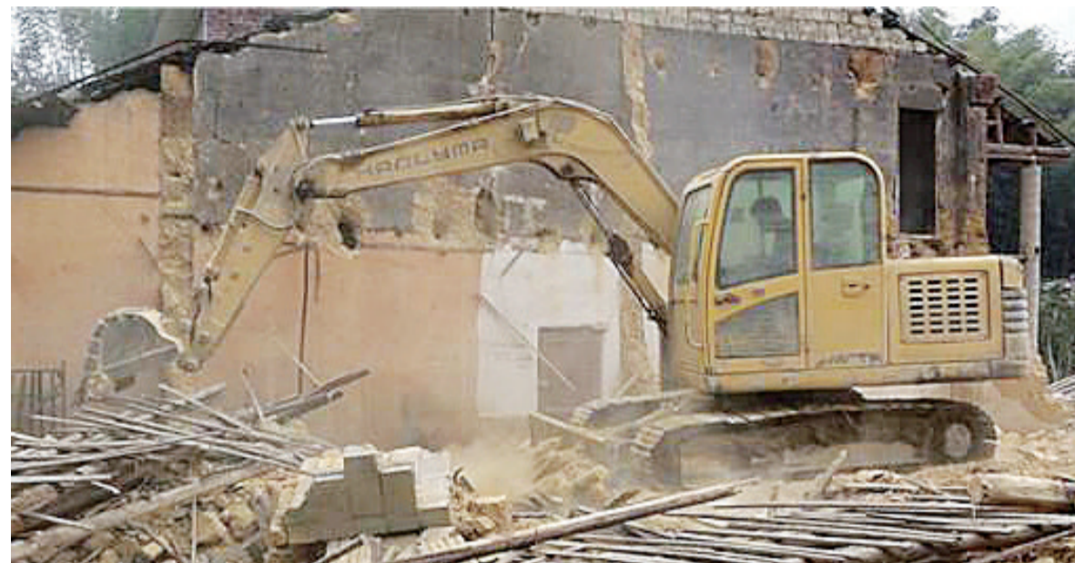
▲龙潭镇花田村一处土坯房被拆除