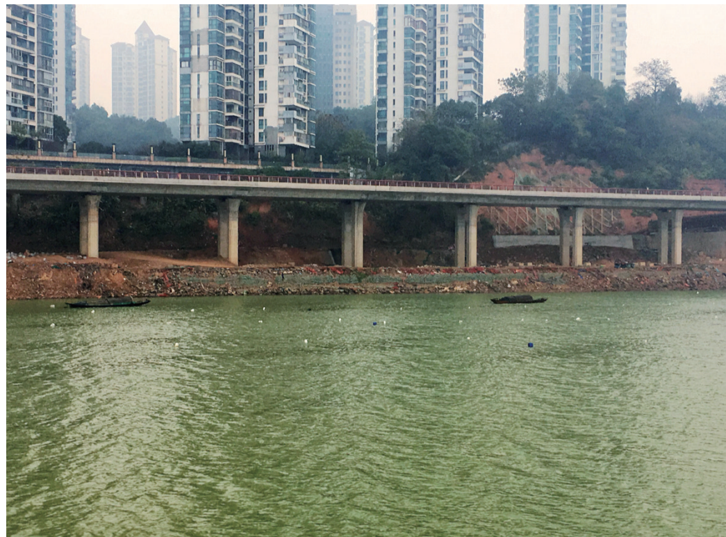
▲昨天,江面上,仍有渔民在饮用水源保护区铺网捕鱼

何剑波表示,湘江河道综合执法已有40多天,各部门还要将人、物、信息真正“联”起来。让信息多跑路,充分利用监控平台,把各个部门与湘江保护有关的信息共享到这个平台。同时,将有关的法律法规做好整合,用严管重罚防止反弹。