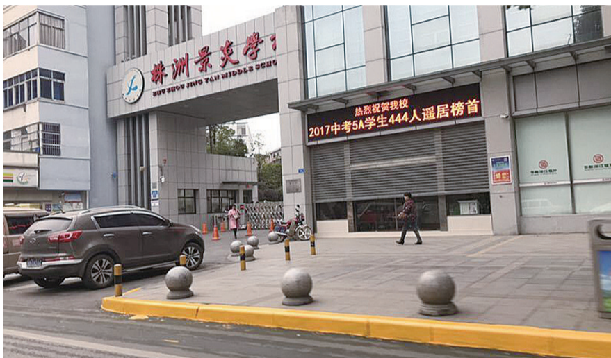
▲景炎学校周边的新华西路沿线,已新划上黄线,该区域路边禁止停车

交警部门表示,学校周边交通秩序整治将形成长效机制,并积极向其他学校延伸,不断扩大范围,提升全市学校周边秩序管理水平。同时,交警借助晚报呼吁学生、家长绿色出行,建议学生尽量采取拼车或乘坐公共交通工具上学,缓解交通压力。