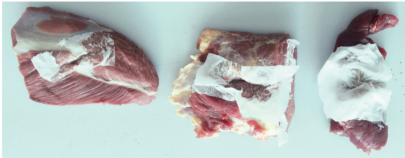
▲从左至右分别是,西海农贸市场、中南蔬菜批发市场、某大型超市购买的牛肉。其中左一,切割后将面巾纸完全浸透,右一,切割后面巾纸上只留下一些油脂