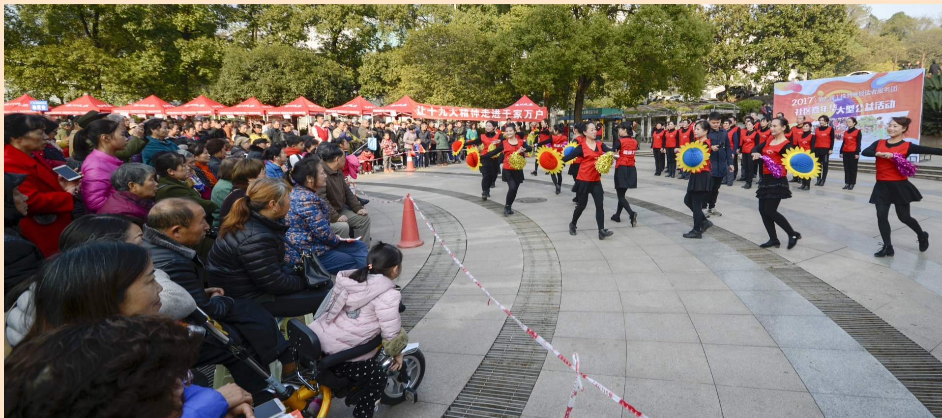
▲文艺节目表演现场