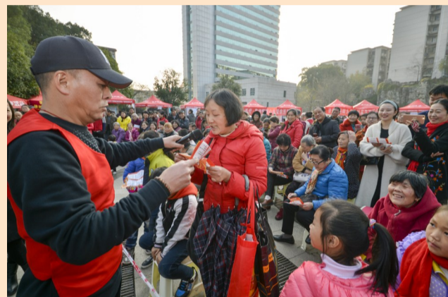
▲十九大主题抢答活动环节