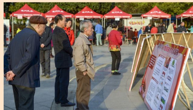
▲市民正在浏览十九大精神进社区板报