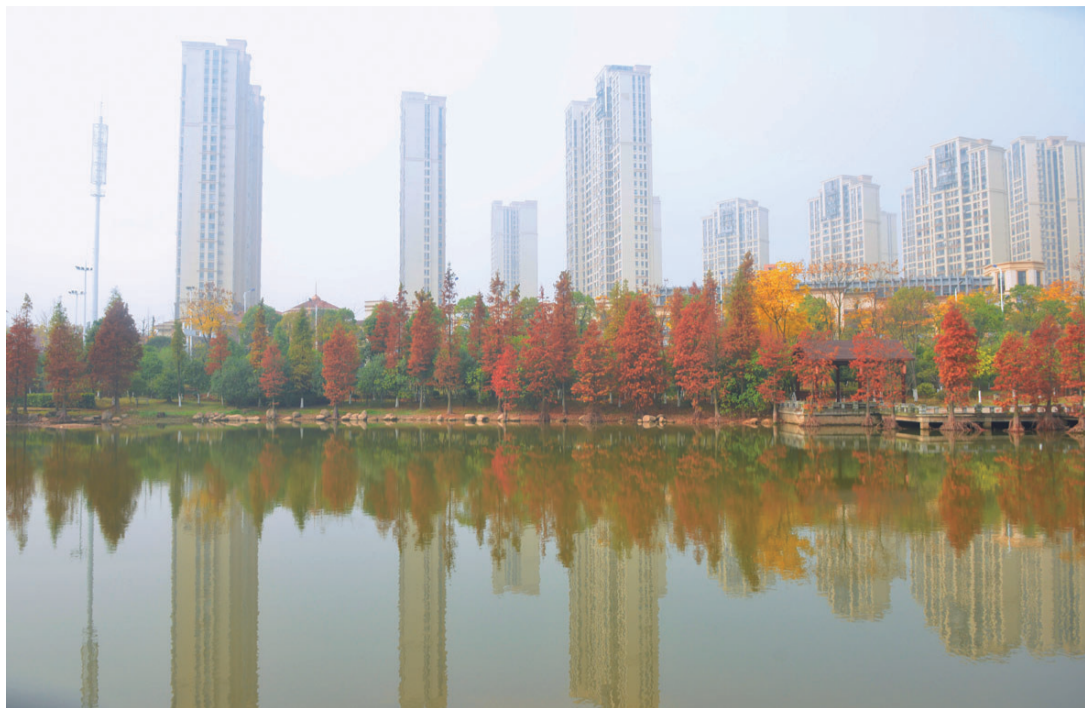
▲12月7日,栗雨湖畔,一排排色彩斑斓的树木扮靓了公园的风景