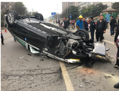
▲事故现场,新车仰翻在地