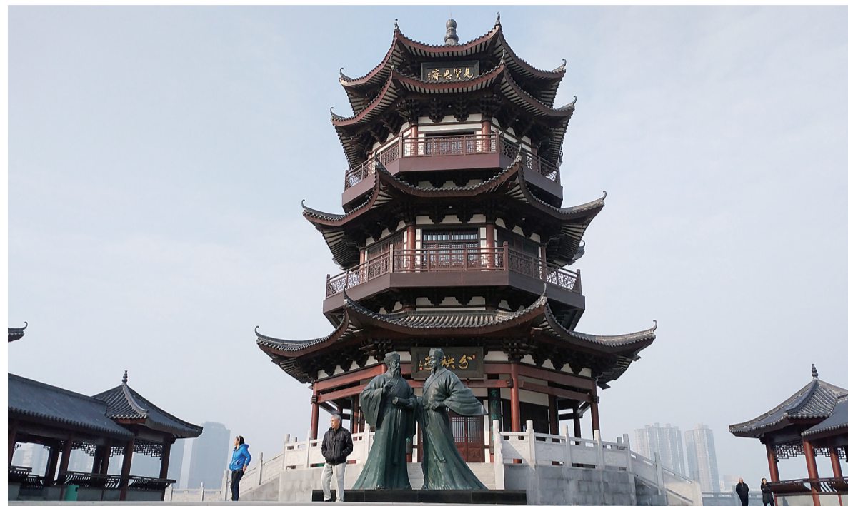
▲分袂亭全景

本报讯(记者 姚时美)近日,河东湘江风光带四桥附近,新建的分袂亭已经落成,其建筑风格为宋元遗风,亭前所立朱熹、张栻雕像则还原了两人当年在此分别的场景。昨天,记者在现场看到,不少市民在这里拍照留念,感受分袂亭背后的故事。