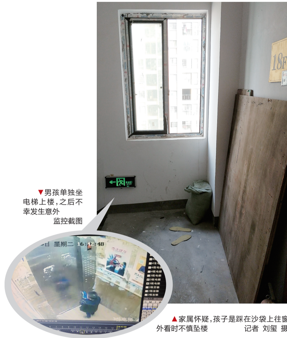
▼男孩单独坐电梯上楼,之后不幸发生意外 监控截图