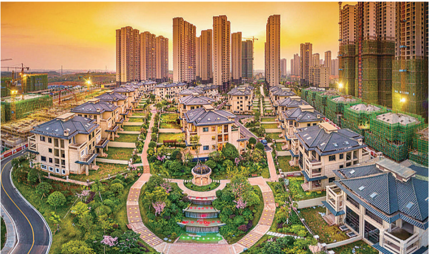
▲华晨·山水洲城实景图

如果说要看今日之华晨,其迅猛发展及华丽蜕变将会更让人印象深刻!想要体验豪宅生活,那就去华晨神农太阳城,神农城心,150米超高层双湖豪宅已经开放;想要体验滨江奢华生活,那就去华晨金水湾“那湾海”吧!全资源景观豪宅不止是一线江景,更有高尔夫、小哈佛幼儿园等配套,项目已经纳入株洲市二中初中部的招生范围;而如果中意大盘社区,那么150万方宜居社区华晨第一城就是最佳选择,三期宫廷大