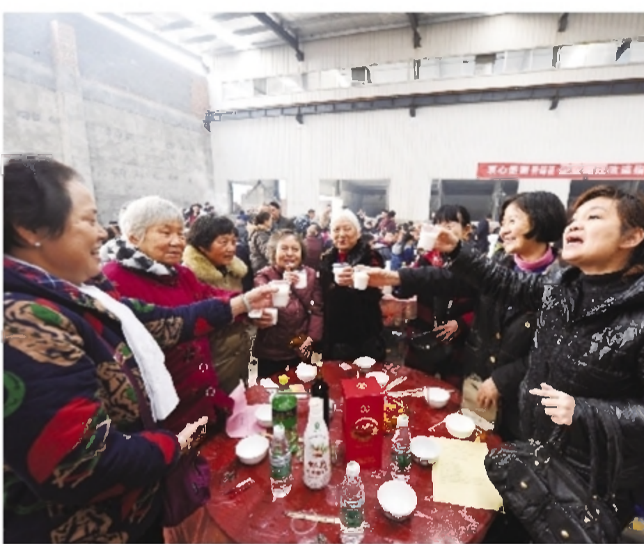
200多名职工及家属共进午餐。

“感恩好时代、好政策,为明天、为友谊干杯!”12月5日,株洲天源纺织有限责任公司(简称天源厂)一处厂房内,写有“衷心感谢石峰区企业搬迁改造指挥部大力支持”等字样的横幅醒目鲜艳,与破旧厂房形成鲜明对比。200多名天源厂职工及家属的两个指挥部工作人员分成25桌,共进午餐,“庆祝企业收储、住户搬迁工作圆满完成”。