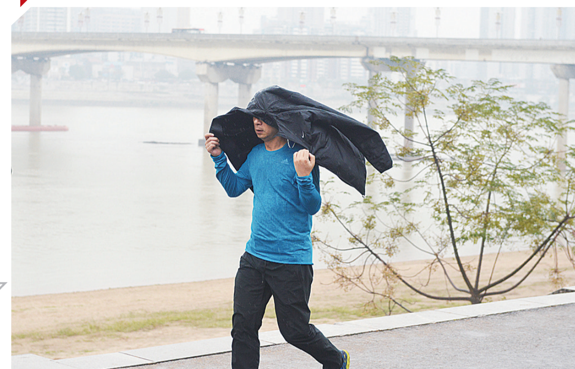
▲昨日下午,天空突然下起雨,一位在河边散步的市民脱下外套来挡雨

每日金句 谈到名声、荣誉、快乐、财富这些东西,如果同友情相比,它们都是尘土。——达尔文