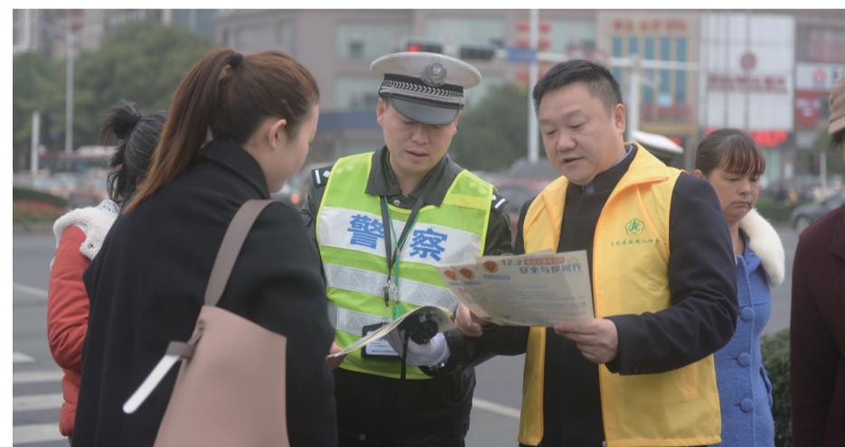
▲残疾志愿者与交警向路人宣传文明交通知识

本报讯(记者 戴凇 通讯员 张家满 许琳)16年前,天元区肢残协会副主席易铁奇因一场车祸造成右臂残废。16年后的“全国文明交通日”,他和天元区肢残协会的40名残废人走上街头,用自己的经历宣传文明出行对交通安全的意义。