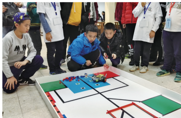
▲第六届国际青少年教育机器人奥林匹克竞赛在西班牙举行,图为比赛现场

本报讯(记者 何春林 通讯员 马冰)1日,第六届国际青少年教育机器人奥林匹克竞赛在西班牙马德里理工大学举行,我市六名小学生凭借娴熟的技术设计和创新能力以及临场应变能力,捧回大奖。