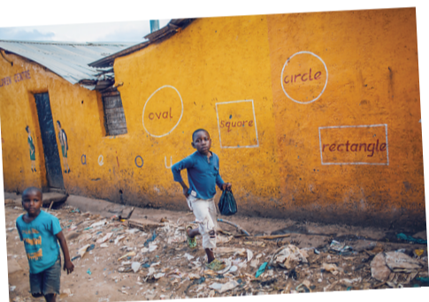
▲贫民窟有些建筑,被涂成彩色