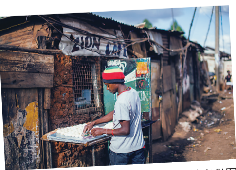
▲贫民窟的小贩