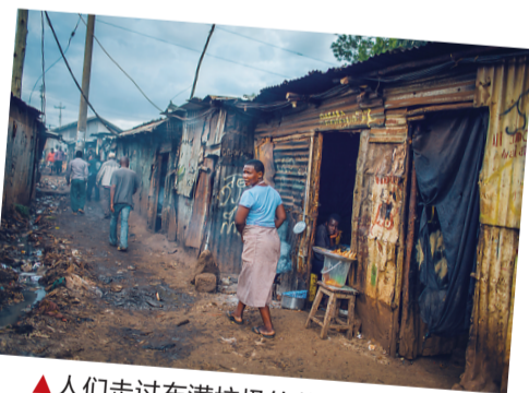
▲人们走过布满垃圾的巷道