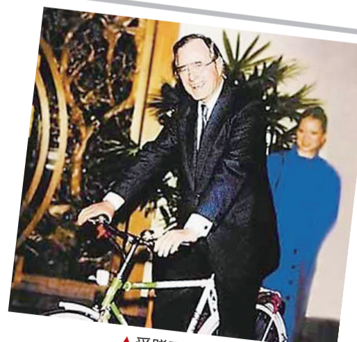
▲获赠飞鸽牌自行车的老布什