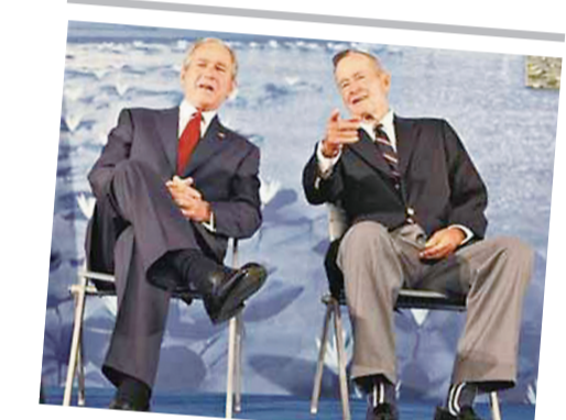
▲小布什(左)与父亲布什(右)