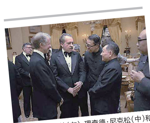
▲吉米·卡特(左),理查德·尼克松(中)和邓小平(右)

2014年9月,年逾古稀的卡特再次访问中国,参加了在人民大会堂举办的纪念中美建交35周年招待会和中美关系研讨会,并先后访问北京、西安、青岛和上海。