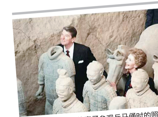
▲里根和他的妻子参观兵马俑时的照片