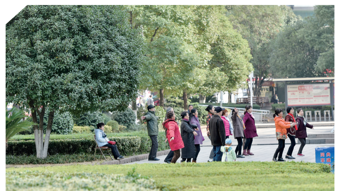
▲昨日,天气转好。在市中心广场上,市民一边沐浴阳光,一边跳广场舞

每日金句 不管前方的路有多苦,只要走的方向正确,不管多么崎岖不平,都比站在原地更接近幸福。 ——宫崎骏