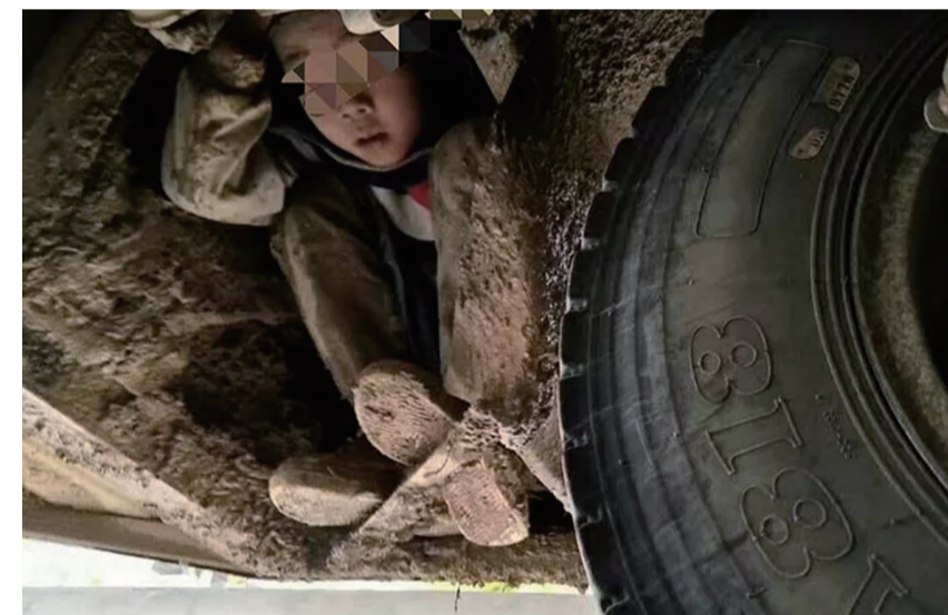
▲男孩藏身班车车底