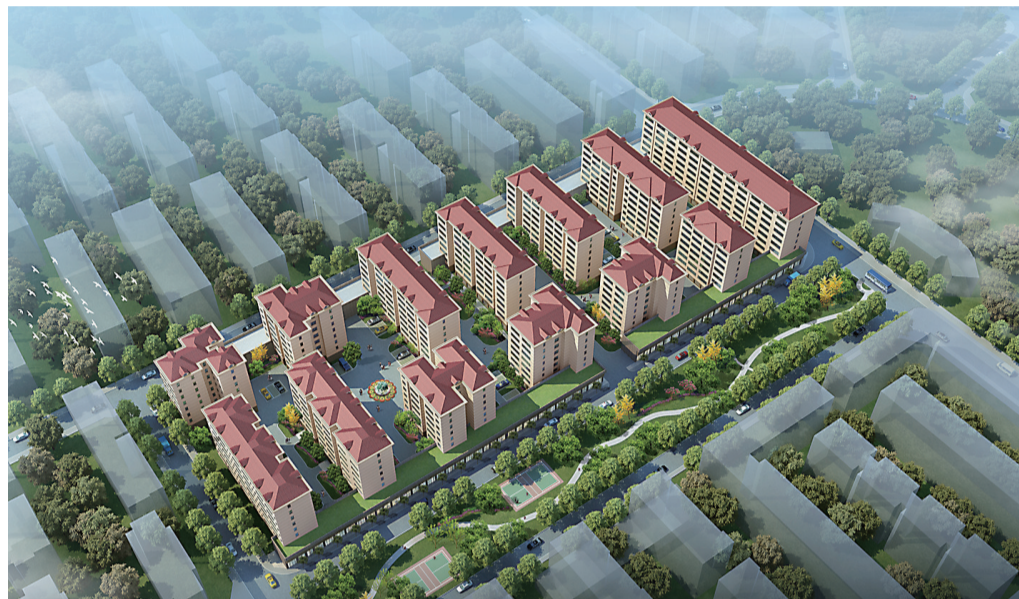
▲德政花园小区改造后效果图

今年3月,我市发布《株洲市旧城提质改造三年行动实施方案(2017-2019)》,将用三年时间,在城区实施棚户区拆除新建、历史文化特色街区保护、老旧小区专项整治、农贸市场综合改造、“三供一业”移交社区改造、“两岸一线”景观靓化、小街小巷拉通提质、拆违控违专项整治等八大工程。