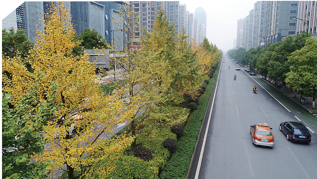
▲昨日,天元区庐山路,金黄的树叶把道路装扮得如同“金色大道”