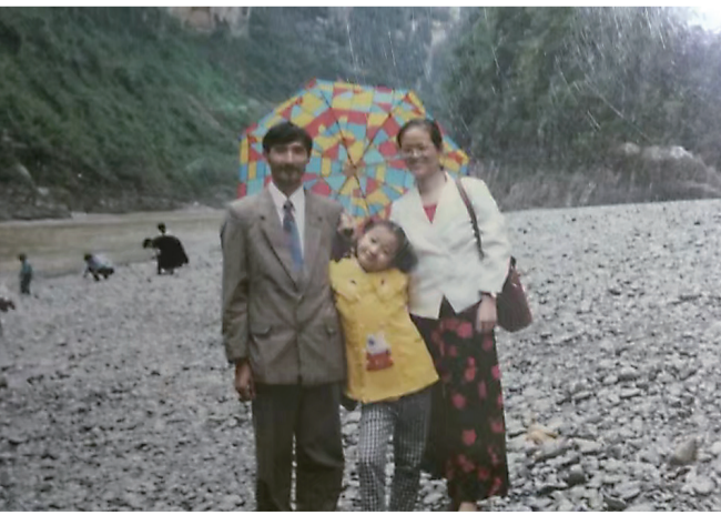
1995年,老爸去武汉参加同学聚会,游玩三峡时拍摄的全家福。愿时光不老,愿父母安康,愿天下家庭幸福美满!