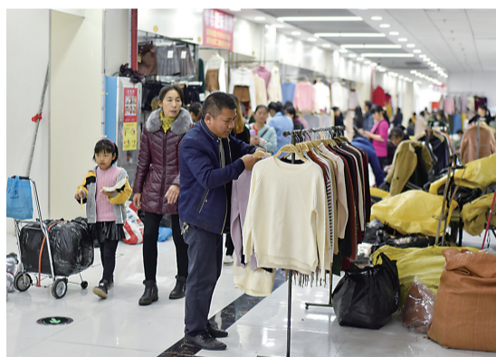
▲早市商贩迁入新天地市场营业

合泰涵洞早市经过多年整治,总是难以根除,此次取缔,仍有不少市民担心:这次会不会又像以往那样“好景不长”呢?