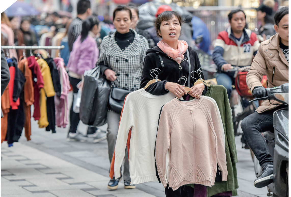
▲11月17日,在芦淞市场群,气温降低,售卖毛衣的生意火了起来

每日金句 道德普遍地被认为是人类的最高目的,因此也是教育的最高目的。—— 赫尔巴特