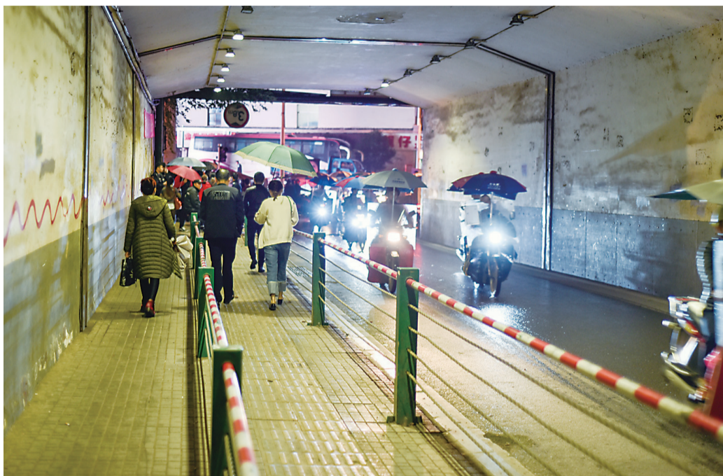
▲早市取缔首日,通行通畅的合泰涵洞