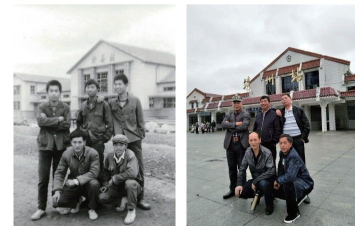
左边的老照片是我们5名战友参加三线建设,于1974年修建靖县火车站时留下的合影。右边这张新照片是我们5名战友(后排左一是我本人)于2017年10月14日重游故地时特意拍的对比照。如今,我们都已是花甲之年的老人,都过着幸福的晚年生活。