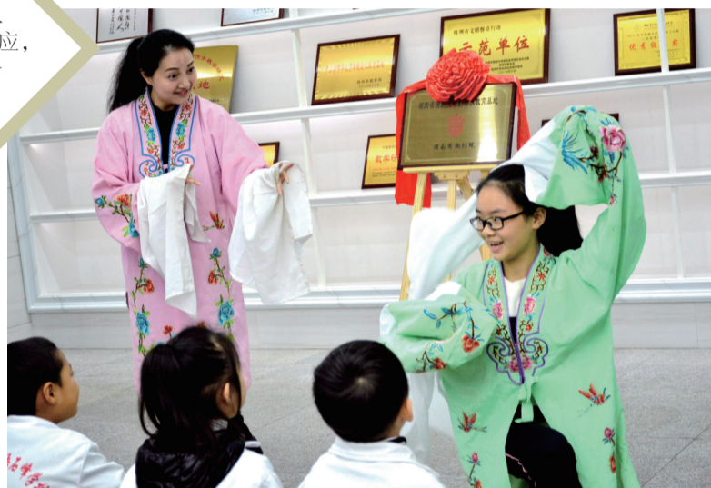
▲石峰区外国语学校学生和师傅表演湘剧