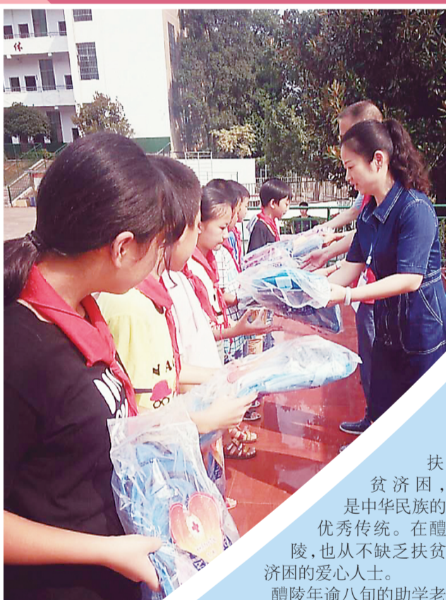
◀ 爱心人士捐赠物资