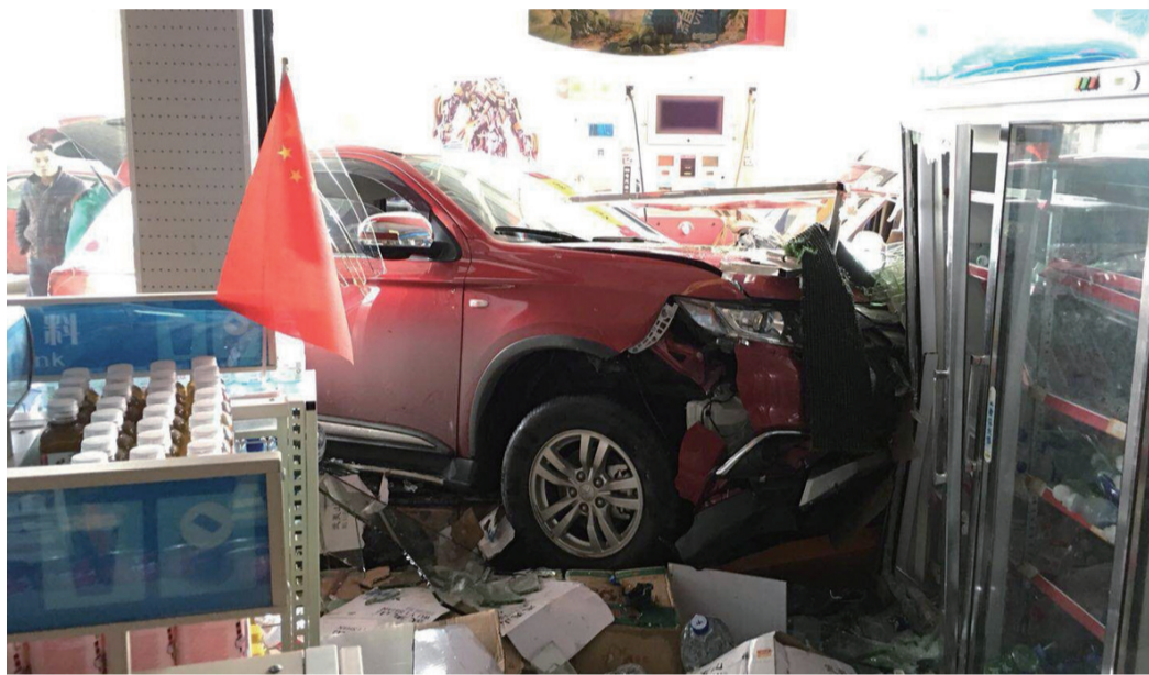
▲红色越野车撞坏营业厅大门及一侧冷柜

本报讯(记者 陈驰)昨天上午9点多,在天元区泰山西路西环桥附近一加油站,一辆红色越野车突然撞入营业厅大门,期间还撞开了一辆面包车,险些伤人。这究竟是咋回事?