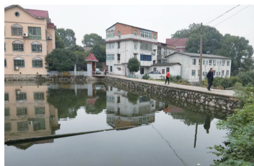
▲事发水塘