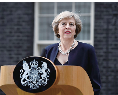
▲英国首相特雷莎·梅

英国媒体12日报道说,目前已有40名保守党议会下院议员同意将联名致函保守党党魁、英国首相特雷莎·梅,表示不信任她的领导,并要求她下台。