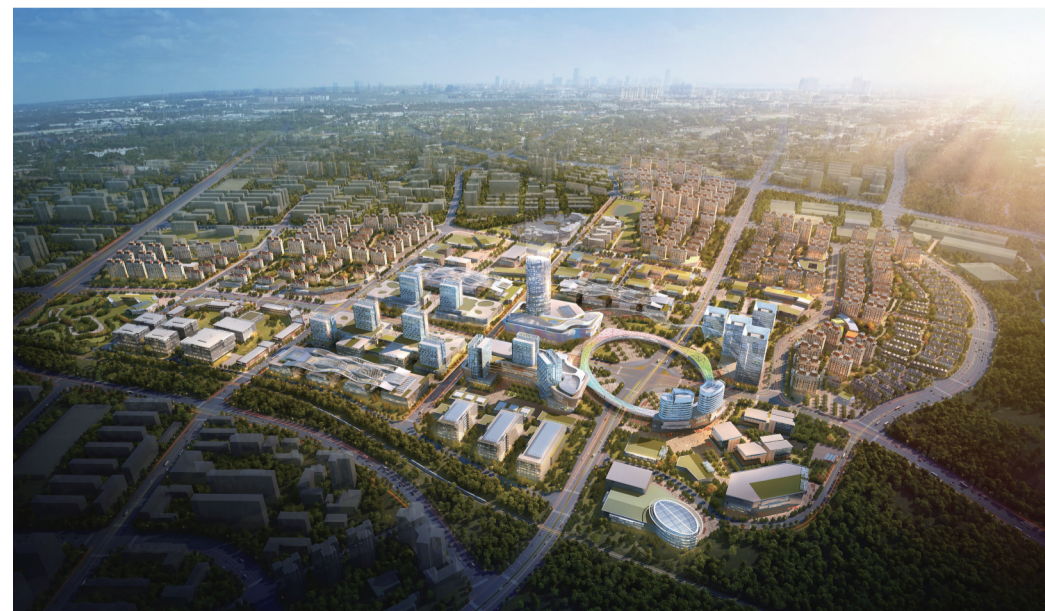
▲龙泉核心片区规划效果图

现有的芦淞服饰产业集群以1.5平方公里的土地,承载着100万平方米的营业面积、38个专业市场、2.8万户服饰经营户、10万从业人员,是中南地区最大的服装市场群和区域性、国家级、现代化的物流中心。目前25.5平方公里的服饰产业新城正在加快开发建设,分为芦淞市场群、龙泉核心片区和白关服饰产业园三大板块,目前白关服饰产业园已有多家企业入驻。