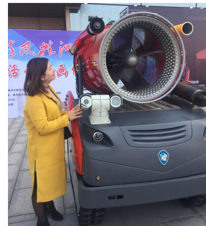
▶高科技消防机器人吸引市民的注意

“它可以喷射水和泡沫,还可以排烟,在隧道、大型建筑、石化油库等区域发生火灾时,如果火场情况不明,可以先让它进入火场侦查,从而减少消防员的危险。”一名消防员说。