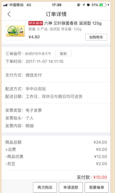
▲原价4.8元一块的香皂,唐先生用2元一块买到 记者 肖蓉 截图