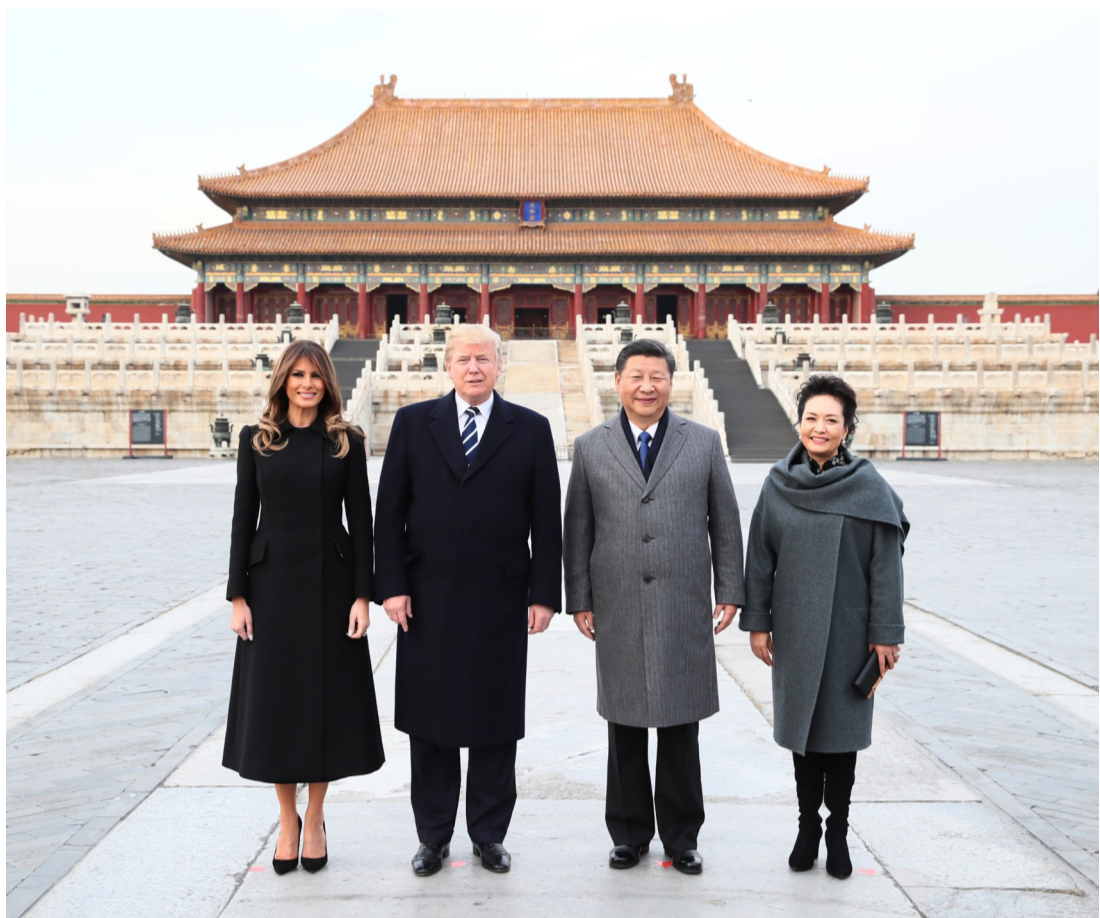
▲中美两国元首夫妇在太和殿广场合影

应国家主席习近平邀请,美国总统特朗普8日下午抵达北京,开始对中国进行国事访问。这是特朗普今年初就任美国总统以来首次访华,也是中共十九大胜利闭幕后中方接待的第一起国事访问。除了全套国事活动,中方还将安排两国元首进行小范围、非正式互动。国家主席习近平和夫人彭丽媛8日陪同来华进行国事访问的美国总统特朗普和夫人梅拉尼娅参观故宫博物院。两国元首夫妇在故宫宝蕴楼茶叙,共同参观故宫前三殿,观看文物修复技艺展示和珍品文物展,并欣赏京剧表演。