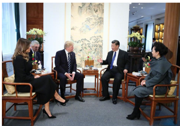
▲两国元首夫妇在宝蕴楼简短茶叙

应国家主席习近平邀请,美国总统特朗普8日下午抵达北京,开始对中国进行国事访问。这是特朗普今年初就任美国总统以来首次访华,也是中共十九大胜利闭幕后中方接待的第一起国事访问。除了全套国事活动,中方还将安排两国元首进行小范围、非正式互动。国家主席习近平和夫人彭丽媛8日陪同来华进行国事访问的美国总统特朗普和夫人梅拉尼娅参观故宫博物院。两国元首夫妇在故宫宝蕴楼茶叙,共同参观故宫前三殿,观看文物修复技艺展示和珍品文物展,并欣赏京剧表演。