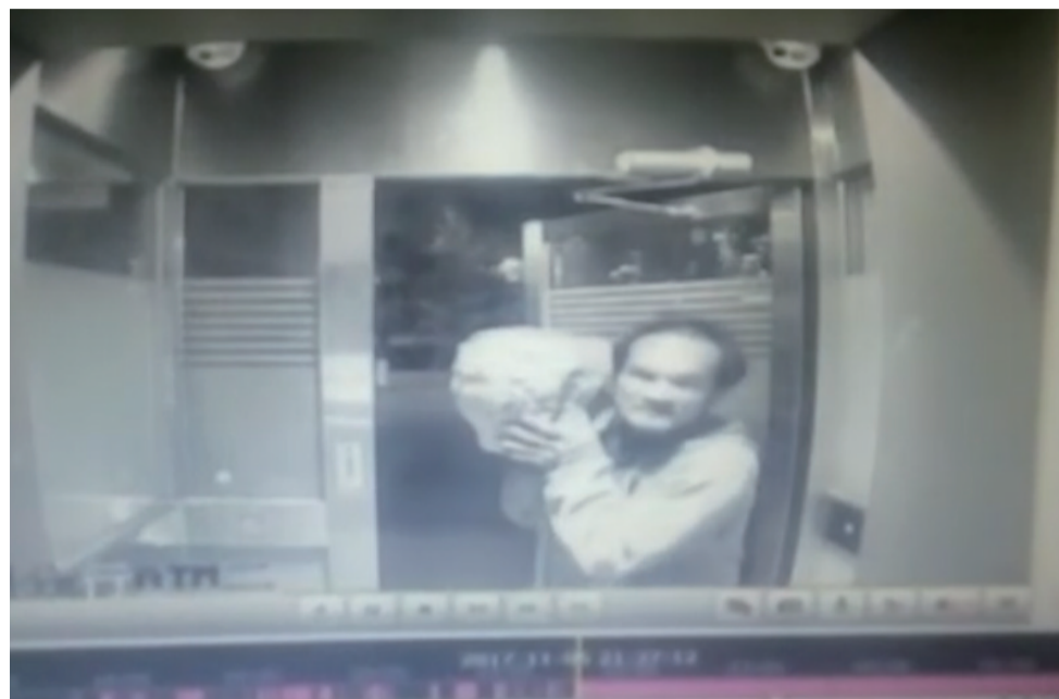
▲男子举着石头砸向ATM机 视频截图

本报讯(记者 陈驰)昨天上午,记者了解到,市区一银行ATM机居然被砸了。这究竟是咋回事?