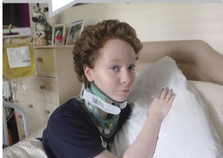
期待早日手术成功。

很显然,这个小家伙在它的主人搬走后,只能在街头独自谋生。但是,它一直期待着它的主人回来找它。上周,这只狗狗被志愿者组织领走了。一段志愿者来拯救这只狗狗的视频显示,当志愿者们出现时,这只狗狗并不想离开主人的老房子大门前,在附近继续徘徊了很久,看得让人心碎。