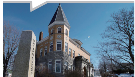
图书馆之旅想想都欢乐。

印度的卫生危机如今已是当务之急。最新的人口普查数字显示,印度53%的家庭在2011年没有厕所。粪便大量挤压了公共空间,传播每年造成数十万人死亡的疾病。儿童,特别是经期女孩,因厕所的匮乏而逃学。一份报告指出,2015年印度卫生问题的经济成本为1065亿美元,占该国国内生产总值的5.2%。