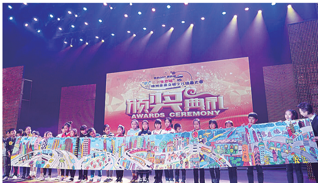
▲部分爱好绘画的参赛选手在颁奖活动现场，集体完成了长达十米的“未来株洲”画作

本报讯(记者 何春林)昨天下午，主题为“我的BRT·我的城”的株洲未来之城少儿绘画大赛落幕。孩子们用手中的画笔，描绘了我市快速公交以及未来城市的模样。