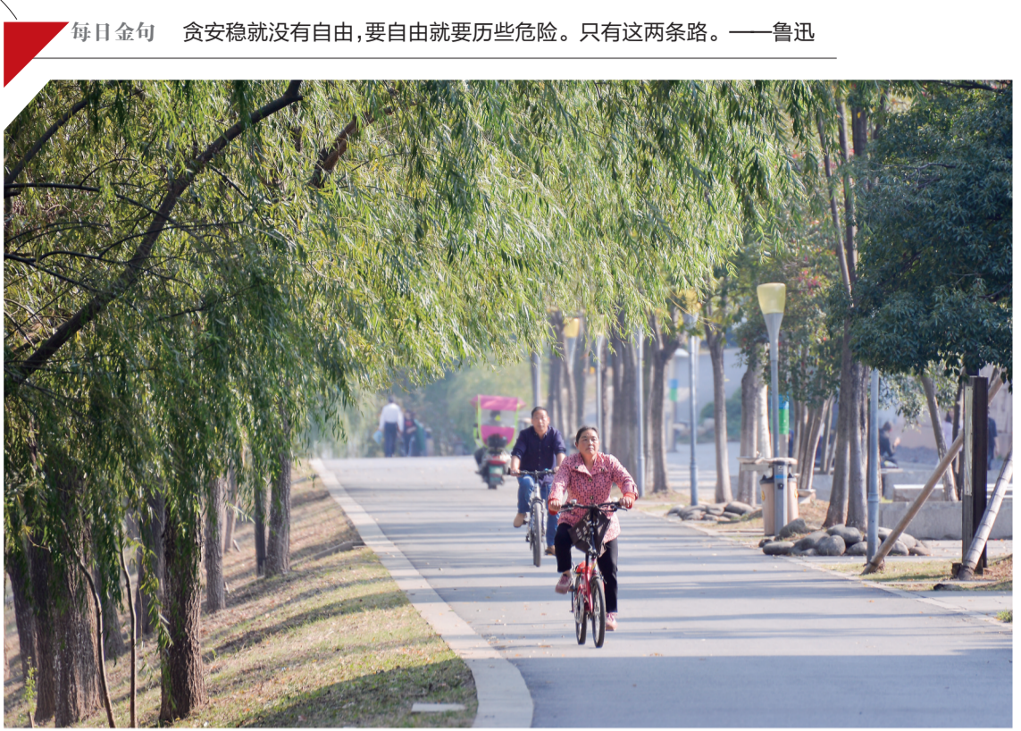
▲昨日,秋阳暖人,在河西风光带上,不少市民骑车休闲,十分惬意