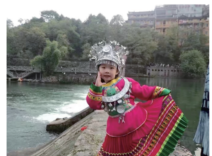
图片拍摄于2011年,是女儿五岁时在凤凰留影。转眼间,小可爱已经上六年级了,变得更加乖巧懂事。爸爸愿你快乐成长,做最好的自己!