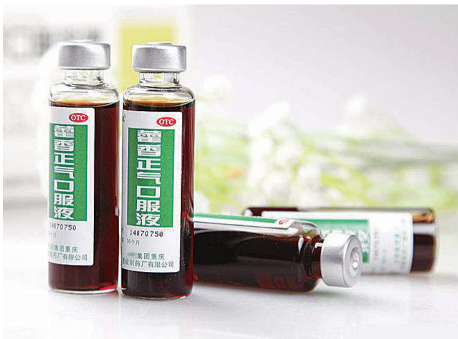
▲霍香正气口服液因含马兜铃酸被列入名单

一篇马兜铃酸的重磅论文,近日登上权威医学期刊《科学—转化医学》封面。论文称,在中成药里广泛存在的马兜铃酸成分和亚洲人的肝癌相关。与此同时,一份含马兜铃属药材的药品名单在坊间流传。马兜铃酸真的会导致肝癌?含马兜铃酸的药是否都不能吃了?我们的传统中药又是否安全?记者进行了调查。