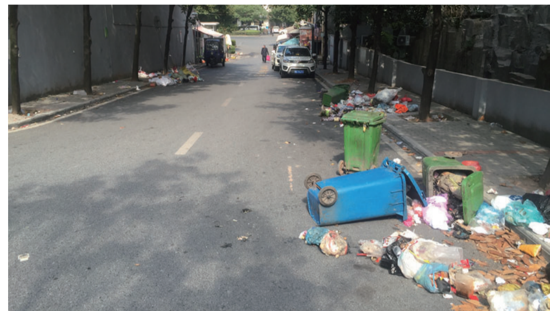
▲小区路边垃圾满地,散发着异味