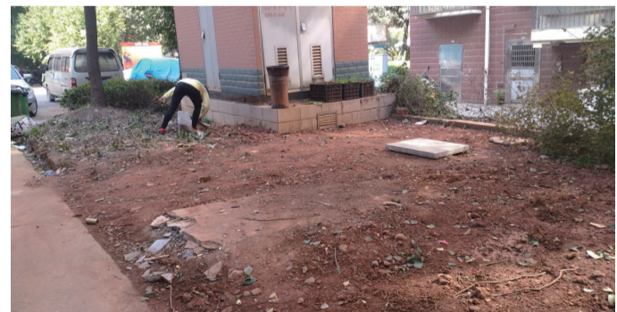
▲一名居民正在毁绿地

至于小区养鸡等行为,该工作人员也说得轻描淡写。爆料人易女士说,之所以会出现毁环绿地的现象,是因为该小区是安置小区,物业公司缺乏有效管理,“业主纷纷毁环绿地,目前已经处于失控状态”。