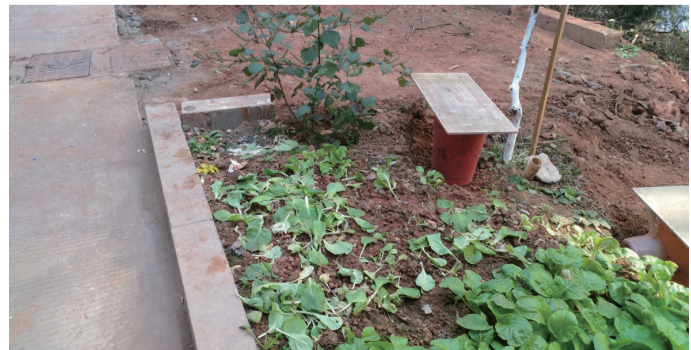
▲绿化带被毁,种上蔬菜