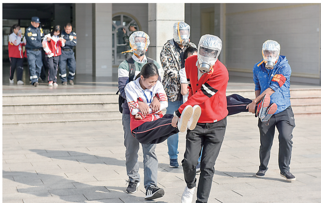
▲昨天,外国语石峰学校举行防空演习。图为人防救护队员协助学生撤离

另外,按《人防法》第五条规定,人防工程平时由投资者使用管理,收益归投资者所有,也就是说平时可以进行租赁或出售使用权。