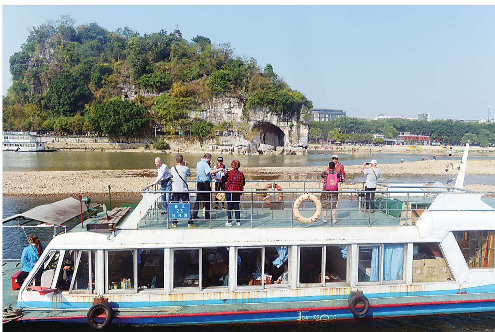
▲桂林象山前,大家登上船顶欣赏美景