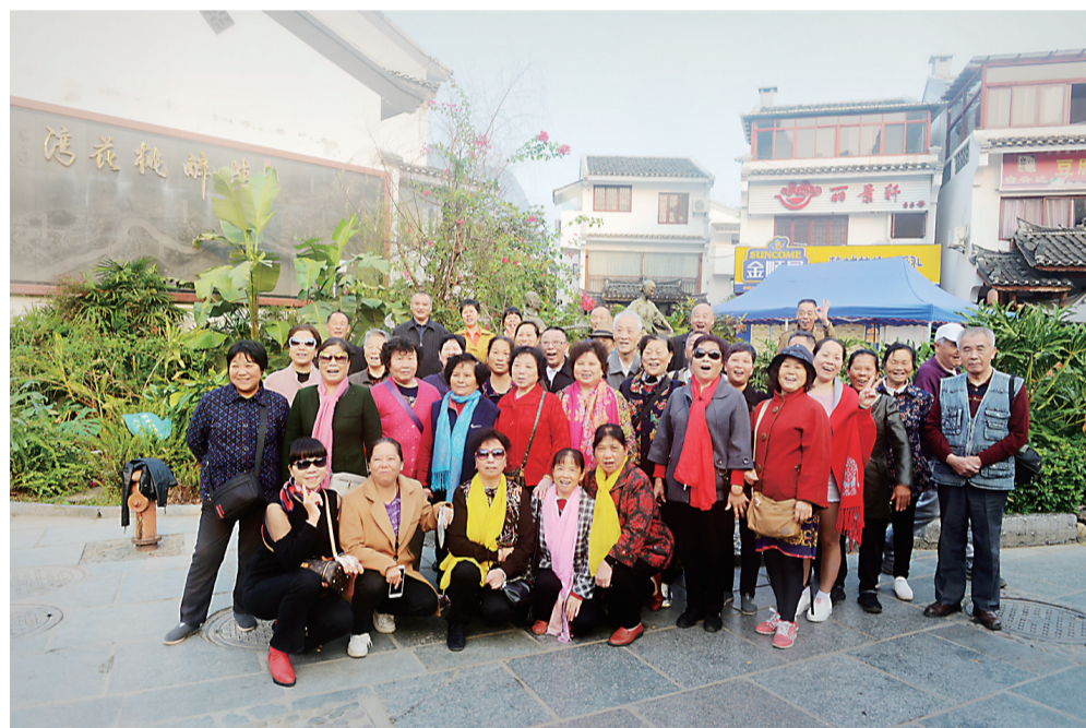
▲部分团友合影留念

秋季,厌倦了都市喧嚣的你,不妨和我们一起出去透透气吧!前日,株洲日报社首批订报读者团已满载而归。大家除了收获了亲近大自然的那份小清新,相互间还有了更深的亲情和友情。