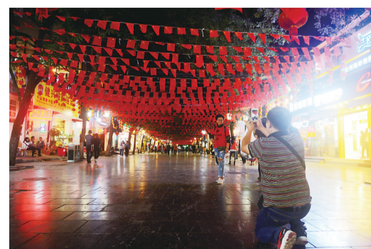
▲桂林步行街的夜景,让团友抓紧时间拍照