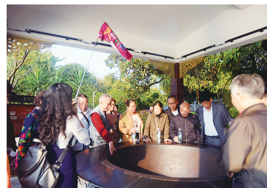
▲团友们围成一团,认真听导游讲解

另外,每个订户还可获得德心心血管病医院体检卡1张。做心电图免费,做心脏彩超检查或心脏双源CT检查可抵扣200元,其他项目7折优惠。订报热线电话:28823900。