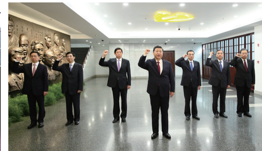
▲习近平带领其他中共中央政治局常委同志一起重温入党誓词

党的十九大闭幕仅一周,中共中央总书记、国家主席、中央军委主席习近平带领中共中央政治局常委李克强、栗战书、汪洋、王沪宁、赵乐际、韩正,于10月31日专程从北京前往上海和浙江嘉兴,瞻仰上海中共一大会址和浙江嘉兴南湖红船,回顾建党历史,重温入党誓词,宣示新一届党中央领导集体的坚定政治信念。