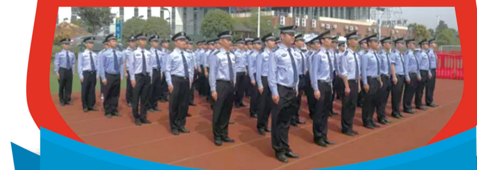
▲天元公安分局民警实战演练现场