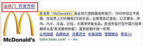
▲麦当劳改名“金拱门”

截至2008年,日本有五所中文学校:两个在横滨,一个在神户,大阪和东京。三个针对台湾,两个面向大陆。相比完全自由,凭借移民自身努力和当地人融合产生的美式中餐。日本配置了专门给中国人的学校,对于中国饮食文化从官方到民间都是持欢迎态度。再加上中国人在日本已经接近70万的永久居留人口(未入籍还是中国人),日本的中华料理自然更接近原版。