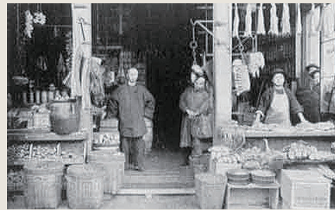
▲19世纪的旧金山唐人街

其中比较典型的美国化产品有斯普林菲尔德风味腰果鸡(一种融合面包炸鸡,腰果和牡蛎酱的腰果鸡风格)、圣保罗三明治、周末三明治、筷子三明治。这些相信你听名词就知道和传统中餐已经没有半分关系了。