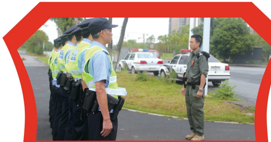
▲天元公安分局民警实战演练现场