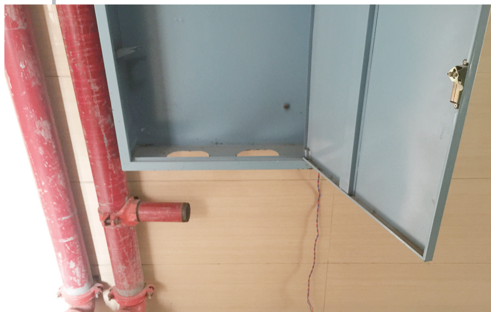
▲既未安装消防栓接口，也未接通水源