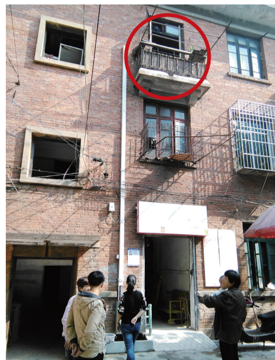
▲健健就是从3楼的阳台处坠楼

本报讯(记者 戴凇)刘黎明至今还在为4天前的一次意外感到无比自责:10月23日下午,丈夫还在上班,她带着小女儿下楼晒太阳,几分钟后,3岁儿子健健从阳台坠下三楼。目前,健健仍在省儿童医院抢救,巨额的医疗费成了这个家庭难以承受的重担。