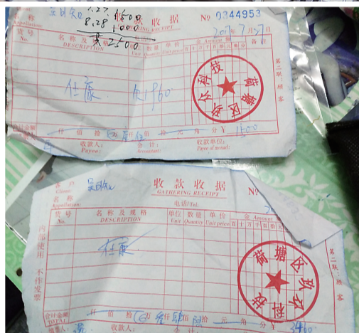
►吴爹爹买保健品的收据