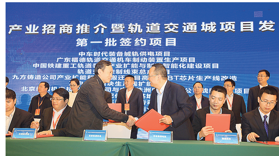
▲项目签约现场